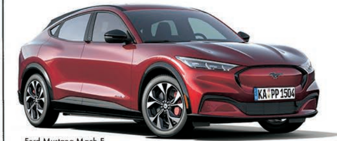
Ford Mustang Mach-E

Damals - ein Problem heute - ein Vergnügen